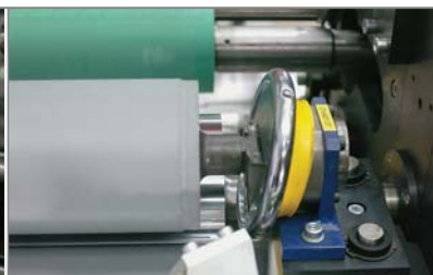
6 Flexible Transferwalze Für minutschnelle Produktionsbereitschaft und Maschinenumrüstung sowie den Einsatz von unterschiedlichen Folienbreiten.