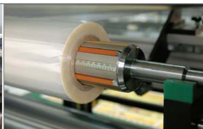
5 Wickelwelle Für Filmrollen bis 6000 m Länge, Innendurchmesser 76 oder 152 mm.