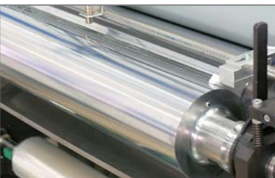
4 Klebewerk Mit Dreifach-Walze für minimale, präzise einstellbare Dosierung.