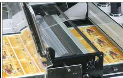
7 Doppeltes Reinigungssystem Mit absaugender Doppelreinigungsbürste und heizbarem Kalander für gleichbleibend saubere und glatte Oberflächen.